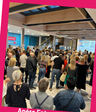
Apéro Entrepreneurs à la Turbine

www.club-entrepreneurs-flandre-dunkerque.fr